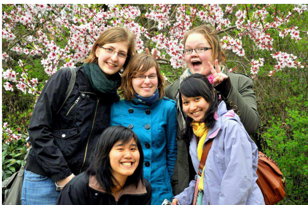
Beutazó diákok 2010/11-es évfolyamból

A fogadás nem jelenti automatikusan azt, hogy a család gyermeke is kiutazik egy évre a cserediákhöz, ahogy a magyar kiutazóknak sem kötelező külföldi diákokat fogadniuk.