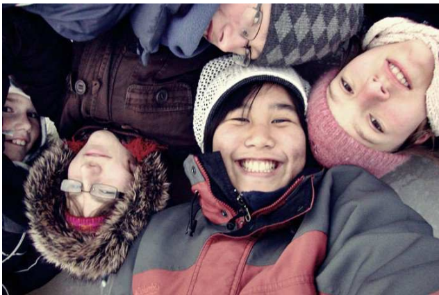
Thai diákunk, Min fogadócsaládjával 2010/11

A magyar YFU-nak amellett, hogy intézi a kiutazó diákok ügyeit, egyik legfontosabb feladata, hogy egy iskolaévre fogadócsaládokat találjon a beutazó diákok számára. Évente 20-25 külföldi diák érkezik Magyarországra.