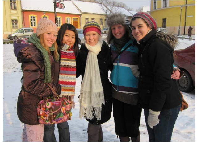
Cserediákjaink Esztergomban 2010. január (német, kínai, észt és uruguayi lányok)

A diákok a fogadócsaládokon keresztül ismerhetik meg a magyar életet, szokásokat és kultúrát. A családok nyújthatják a legnagyobb segítséget a beilleszkedésben, ismerkedésben, és mindezek mellett, a nyelvtanulásban is. Az együtt eltöltött csereév egy életre szóló kapcsolatot jelent mind a családnak, mind a diáknak.