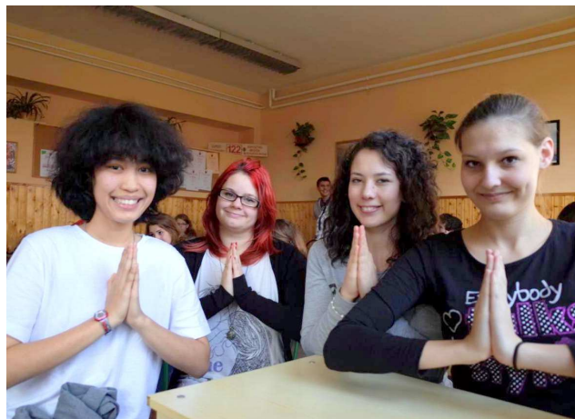
THAI DIÁKUNK PIY ÉS OSZTÁLYTÁRSAI, 2014/15

Amennyiben felkeltettük érdeklődésüket, forduljanak hozzánk bizalommal!